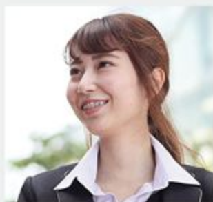
経営企画部総務経理課 | 2017年入社

学生時代、就職活動中に悩んだ経験があって、「人に仕事を紹介する仕事」に魅力を感じたのかもしれない。困っている人たちの力になれば、喜ばれますからね。ヒューマンアイズを志望したのは、そんな「人の役に立ちたい」という気持ちからでした。特にやりたかった面接・採用を任せられるようになってから、より一層仕事が面白いと感じるようになりました。