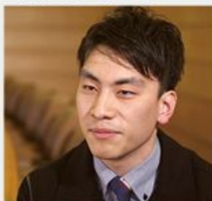
名古屋統括事業所 | 2017年入社